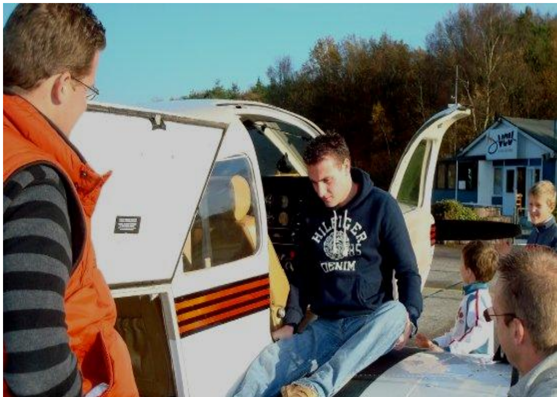
Fig. 01 – De allereerste kennismaking: testen van de transfer in & uit het vliegtuig.

Let wel: de optie safety pilot is wel enkel mogelijk indien de kandidaat-piloot vroeger al een PPL brevet heeft gehaald. Voor het behalen van een dergelijk brevet zijn immers solovluchten verplicht, welke haaks staan op het begrip "Safety Pilot" en de praktische toepassing ervan.