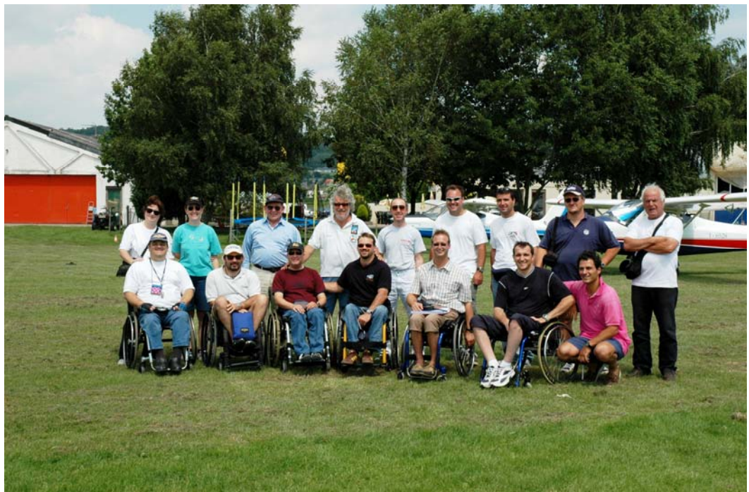
Fig. 04 . Un groupe de pilotes handicapés lors d'un Fly in à Amougies en Juillet 2005.