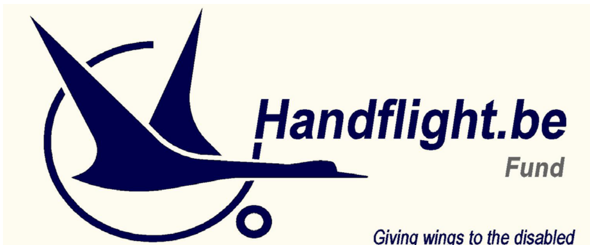
Fig. 04 –Le logo du Belgian Handflight Fund. Fond géré par la Fondation Roi Baudouin.

Il fallait donc trouver une 'entité' qui ne serait liée à aucun club ou association et surtout sans aucune connotation commerciale. Il a été décidé que cette forme juridique serait un fond, totalement intégré et géré par la Fondation Roi Baudouin qui s'intitulerait « Handflight.be Fund » dont le tout nouveau logo est présenté ci-dessous.