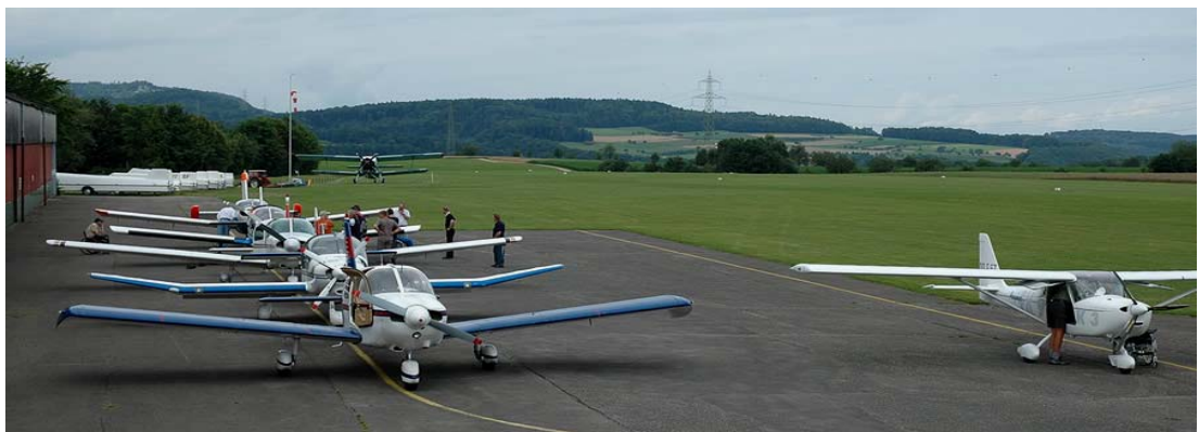
Fig.05 – Tous les avions sur ce photo ont été adapté pour des pilotes handicapés. (Photo pris à Fricktahl Altiport, Handiflight 2008 événement dans la Suisse, organisé par Breitling)