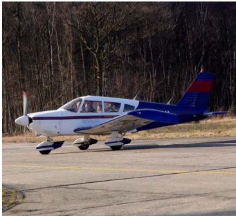
Fig. 1 Piper P28A 182 F-GIYL

Le pilote pousse les gaz, l'avion se met à rouler sur la piste d'envol. Après quelques secondes, la vitesse de décollage est atteinte et ... le moment magique se produit encore une fois, les roues quittent la piste, la terre s'éloigne gentiment. Le pilote vérifie les cadrans puis son regard scrute les alentours et vérifie l'horizon. C'est ce moment de bonheur tranquille et intense que chaque pilote dans le monde connaît si bien. Se trouver aux commandes d'un avion, quel que soit son type, donne ce genre de plaisir si difficile à transmettre à ceux qui n'ont jamais essayé.