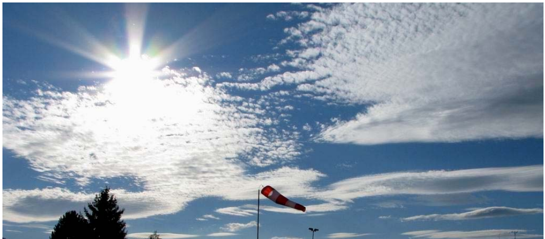
Fig. 05 Le ciel ne sera bientôt plus une limite pour les personnes handicapés des membres inférieures.

Fort de cette première réalisation, nous pourrons, au travers de la presse et des médias et par tous les moyens à notre disposition, lancer un appel à tous les aéoclubs belges, quelle que soit leur discipline aérienne, pour les inviter à s'engager à leur tour dans un nouveau projet.